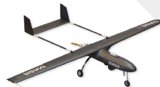
TARSIS 25 RPAS táctico de ala fija